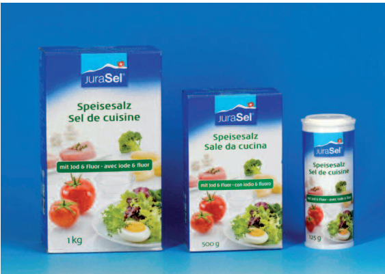
Fluoridiertes und jodiertes Speisesalz.

Geringe Mengen von Fluorid sind im Trinkwasser und in Lebensmitteln vorhanden. Die Fluoridkonzentrationen sind aber im allgemeinen sehr niedrig, so dass keine kariesvorbeugende Wirkung auftreten kann. Für einen wirksamen Kariesschutz steht in der Schweiz seit 1983 das jodierte und fluorierte Speisesalz zur Verfügung (JuraSel im Paket mit grünem Streifen, das 0,025% Fluorid enthält). Zur Grundvorbeugung gehört auch die tägliche Benützung von fluoridhaltiger Zahnpaste.